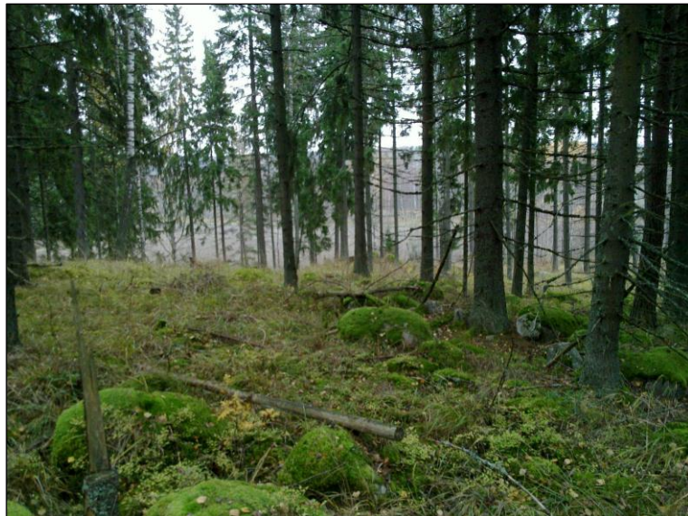
Laen keskiosan eteläreunaa, etelään