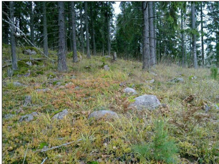
Tasanteen eteläpuolista rinnettä ja sen alapuolella olevaa loivempaa rinnettä