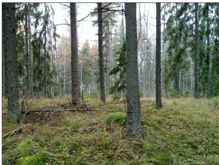
Mäen laen koillisreunaa.