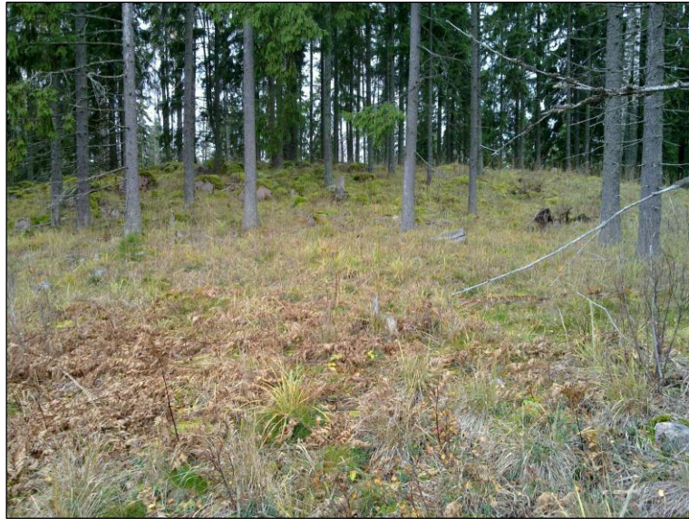
Mäen lakitasanne taustalla, etelärinnettä, pohjoiseen.