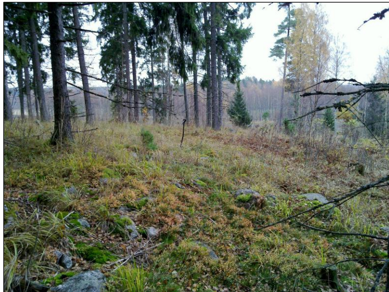
Lakitasanteen eteläpuolella, alemmalla tasolla olevaa loivaa rinnettä