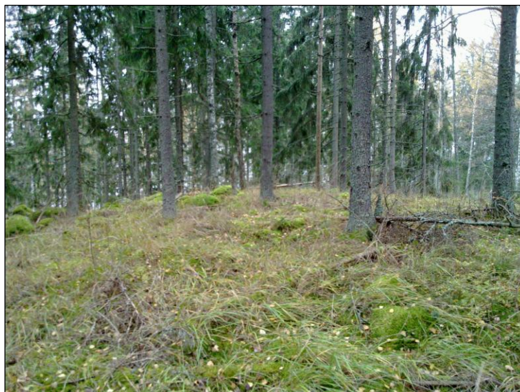
Mäen laen eteläreunaa, itäpäästä länteen.