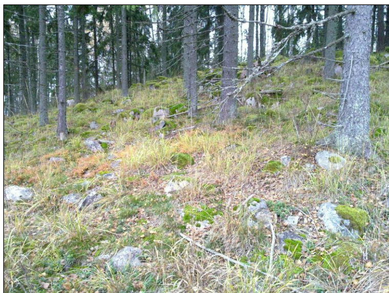
Lakitasanteen eteläpuolista rinnettä.