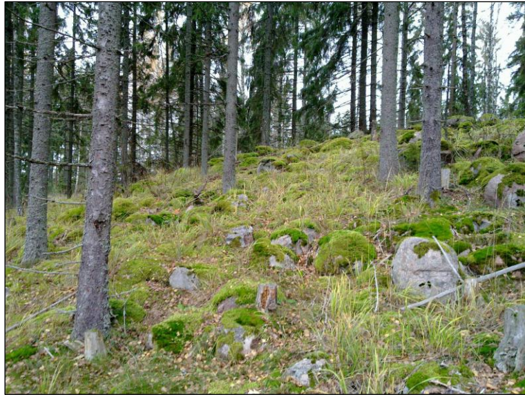
Lakitasanteen eteläpuolista rinnettä.