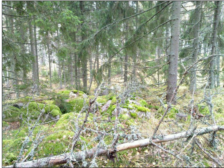
Lakitasanteen länsiosan etelärinnettä.